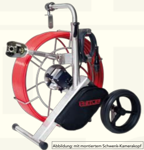
Abbildung: mit montiertem Schwenk-Kamerakopf